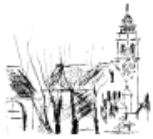
St. Bonifatius Überherrn